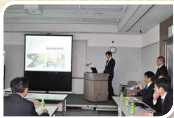
防犯対策機器のデモンストレーション